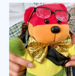
なかがわ ダイバーシティ ラウンジ富山 代表